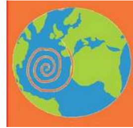
Le Média du voyage durable